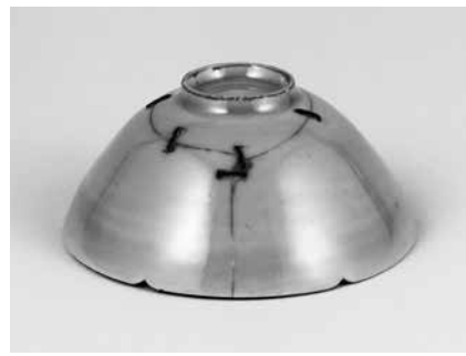
東京国立博物館蔵（重要文化財）

たことよって、この茶碗の評価は一層高まり、馬蝗絆と名づけられた」と説明されている。