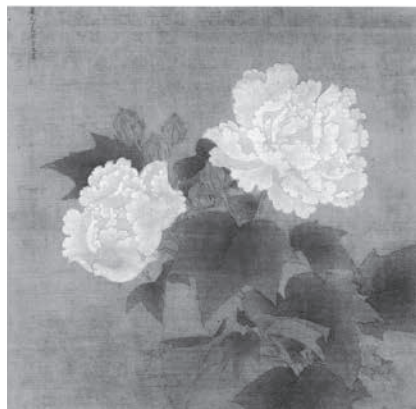
「紅白芙蓉図」(白) 李迪筆 中国 南宋時代 展示期間 5月23日～6月4日

いて、建蓋の第一位、「世上になき物」と評された「曜変」や、それに次ぐ「重宝」と評された