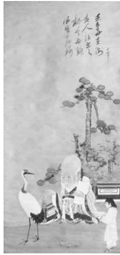
図3 狩野山楽画三亡羊賛 〔福祿寿（個人蔵）〕

ろ、この作品は現在、個人が所蔵していた（図3）。箱墨書および軸の巻留めに観阿の墨書があり、観阿八十賀で使用された作品と同等とされる。