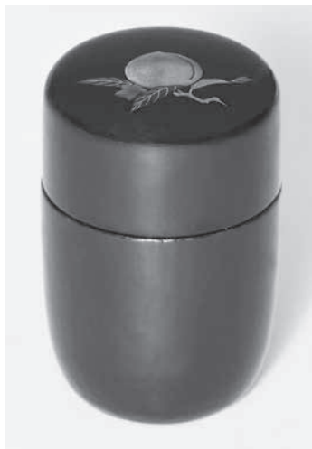
図1 原羊遊斎作「一閑桃之絵細棗」（個人蔵）

を行なったところ、八十賀の茶会記を確認した。そこで本稿では観阿の八十賀と「一閑桃之絵細棗」の関係について述べたい。