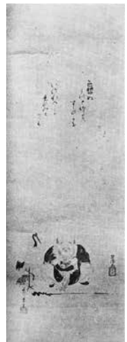
図4 翠濤、宗中、晴川院合作「福祿寿」

と書き、晴川院は鶴亀を描いた。この合作は大正九年（一九二〇）四月二十二日に東京美術倶楽部で開催された朝吹家と野崎家の入札に際して作成された売立目録『朝吹氏野崎氏蔵品入札』に図版が所載される（図4）。この合作を観阿が所望したのは翌年に八十歳の祝いの茶会を催すためのものであった。このように溝口家での観阿は、そこに集う宗中や晴川院などとの交流があり、当然、観阿八十賀茶会にも参会していたものと考えられる。茶会当日、披の間で翠濤、宗中、晴川院の三人に、山楽の原画をみせる趣向であったことがわかる。