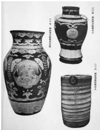
『紀州徳川家蔵品展観目録』より 御庭焼各種

こうして焼きあがった御庭焼は、治宝寵臣や西浜御殿勤めの藩士などに下賜され、民間で作られた大量の陶磁器は、褒美として家臣に与えられている。紀州藩の蔵には、日用品や贈答品としてストックされていた陶磁器が大量にあったと考えられ、売立目録には写真が掲載されていない陶磁器も多い。そのため、目録記載の品物と現在伝わる品物が、同定できない場合も多々あり、紀州徳川家伝来所蔵品の全容解明を阻む要因となっている。