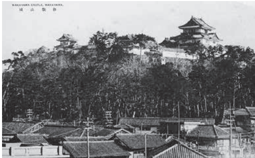
写真の和歌山城は、弘化3年に落雷焼失後、嘉永3年に再建したもの。現在の和歌山城は、戦後の再建。 (和歌山市紀国堂溝端佳則氏所蔵絵葉書)

州徳川家においては、こうした施設がない。その理由は、昭和二年（一九二七）、同年（一九三三）、同九年（一九三四）の三回に渡って、所蔵品が売却されたからである。所蔵道具を書き上げた、いわゆ