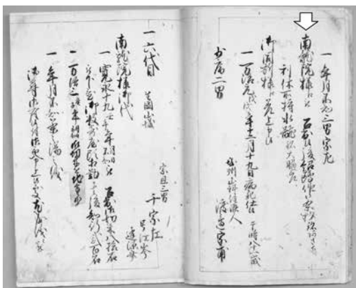
「紀州家中系譜並に親類書上げ 上」（資料番号 7568） 和歌山県立文書館 2011年