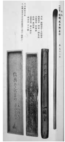
『紀州徳川家蔵品展観目録』より 「紹陽作茶杓銘」あさ地

頼宣自身が、どの程度茶の湯を嗜んだかは判然としないが、家臣に対しては、「少に而も可学茶道を不知は他行馳走のもてなしには先ツ茶の湯なりそれを不知は不骨にてさながら下臈立にて見ゆる」(『南紀徳川史』第一冊)と語っている。つまり、少しでも茶の湯を学ぶべきであり、茶道について知らなければ、外出した先でのもてなし、まずは茶の湯であるが、それを知らなければ、まるで下人のような身分の低い者に見える、とし、武士の教養として認識していた様子がうかがえよう。