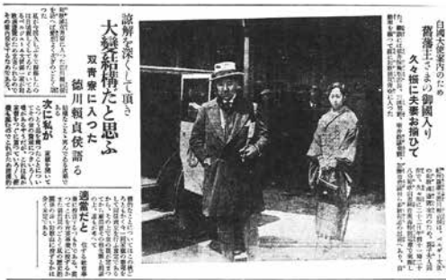
「大阪毎日新聞」和歌山版 昭和2年4月23日、(縮刷版。左端1行欠)

明治に入ると、紀州徳川家当主の興味や関心あるいは趣味は、茶の湯よりも時流に沿ったものに移って行った。具体的には、十五代当主頼倫による平城宮跡の発掘支援、十六代頼貞の楽譜や音楽文献、古楽器類の収集などである。紀州徳川家当主は、時代が変わっても芸術家のパトロンであり、自らも収集家と