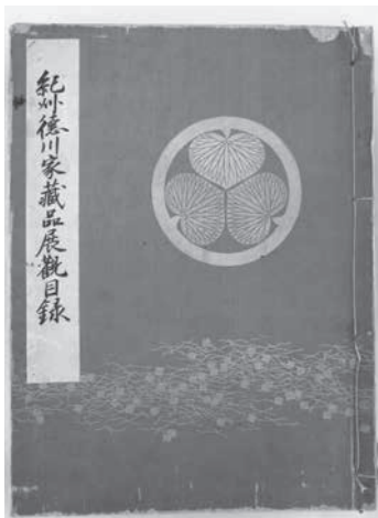
『紀州徳川家蔵品展観目録』 東京美術倶楽部 昭和2年

そのため、紀州徳川家伝来の茶道具の全容を知るよすがは、売却にあたって作成された売立目録のみである。明治後期から昭和初期にかけて、財政的に行き詰ったりするなどした旧大名家らが、伝来の道具を一斉に売却するために、売立、つまり入札会がおこなわれたのである。この時、実物を下見することができない人々に配布するため、『紀州徳川家蔵品展観目録』が作成された。