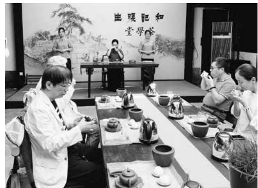
寧波茶文化博物館で茶芸の見学と体験

寧波茶文化博物館で茶芸の見学と体験。各自の前にはポット、茶器一式と茶葉。茶杯は二つずつ置かれている。茶芸師さんより教えていただき白茶を淹れてみる。