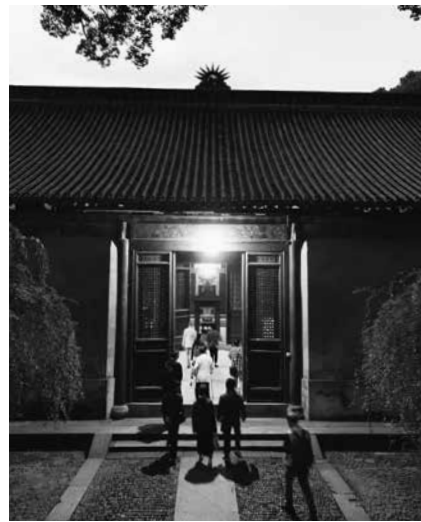
国清寺の朝勤に向う

四時起床。不思議と眠気もたるさも感じない。標高もあり夜明け前は肌寒い。数分山道を下り寺に入る。暗がりには雨花殿からの灯りがもれてきた。さらに進む。本尊釈迦牟尼仏の姿がまばゆい。半時間前から始まっている二百名近くの僧と信者の祈りのただ中に身を置く。鐘に太鼓、声明かと思われ素朴な響きが堂に満ちる。熱心な信者達の声を背中に受ける。真摯な祈りに水をさすようで身の置