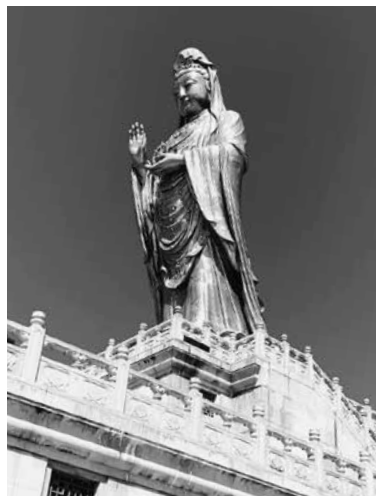
金色の南海観音像

何う。文革時には全山の仏像、樹 木が破壊され、再興されたのはこ こ二十年余り。島内あまたある寺 院の僧は戒律を厳しく守って修 行。中国四大霊場のひとつとして 全土よりの信仰を集め、今日では 政府要人もしばしば訪れる。指先 で数珠の玉を一つ一つ送りつつ静 かに話される住職の中国語は、何 とも上品で心地よい。カップで頂