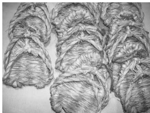
「足半」 （長良川うかいミュージアム展示）

トに広まった履物である。平安期の貴族や中世の武家では、草履のかかと部分がない、尻切（しきれ）や半物草（はんものぐさ）、関東では足半（あしなか）と呼ぶ草履が履かれており、雪駄は尻切から発展したことが、『貞丈雑記』（1784頃）や『松屋叢考』（1826）などの記述からも知ることができるといえる。