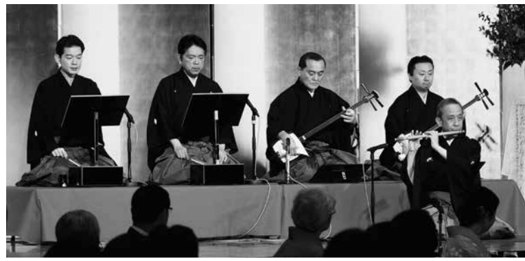
写真4 端唄と清元による祝いの演奏

そのなかでも印象に残ったのが、端唄と清元による祝いの演奏である。それまで茶の湯の祝いの