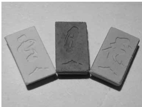
写真2 不白生誕三百年を記念して作られた菓子

がる表千家流の団体で、平成十九年（二〇〇七）の不白没後二百年を機に、不白を偲ぶ茶会を開いておられる。