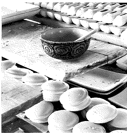
バッチャン焼きの工房

雨が小降りになったころあいを見計らって、近くの茶畑と製茶工場を見学しました。雨なのでただ茶畑を見るだけかと思っていたのですが、茶摘みの方々が、私たちが歩く道の近くで茶摘みをされていました。茶葉を摘む音までも聞こえる至近の距離での茶摘みを見られた事に感激でした。ティエン・イエ製茶工場は茶畑の中にある工場でしたが、