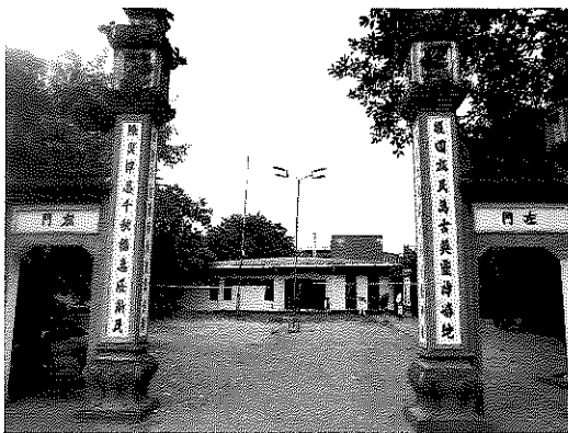
キムラン陶磁器歴史博物館